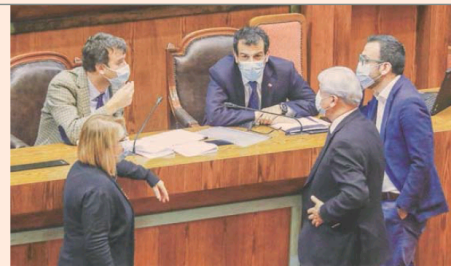
Jornada intensa se vivió en la Cámara por las elecciones.

La reforma constitucional para el cambio de la fecha de las elecciones fue despachada al Senado, donde deberá seguir su tramitación y hasta ayer no había intención expresa de ningún sector de hacerle cambios a lo aprobado en la Cámara, pero eso podría variar en lo que resta de la tramitación, que podría estar supeditada a lo que ocurra con el Bono Clase Media, que también se tramita en la Cámara Alta.